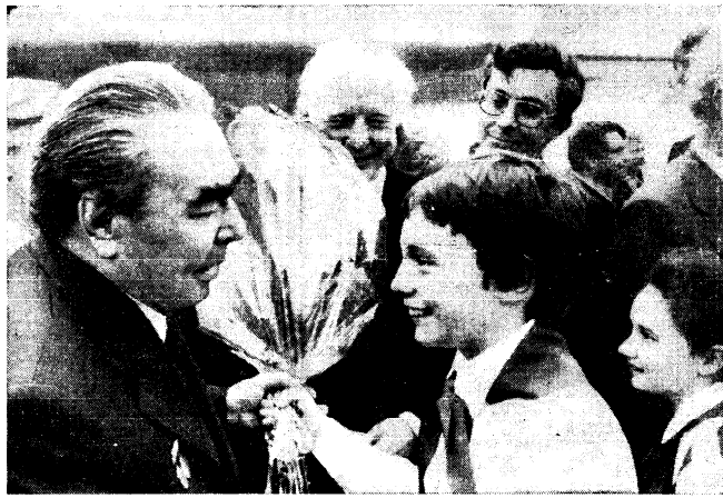
Дети преподнесли цветы Леониду Налову Брежнев.