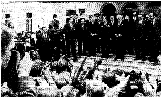
Перед началом беседы с Федеральным президентом В. Шнейдером.