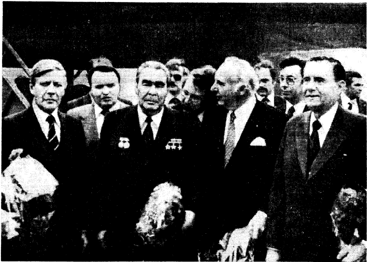
Официальный визит Генерального секретаря ЦК КПСС, Председателя Президиума Верховного Совета СССР Л. И. БРЕЖНЕВА в ФРГ.