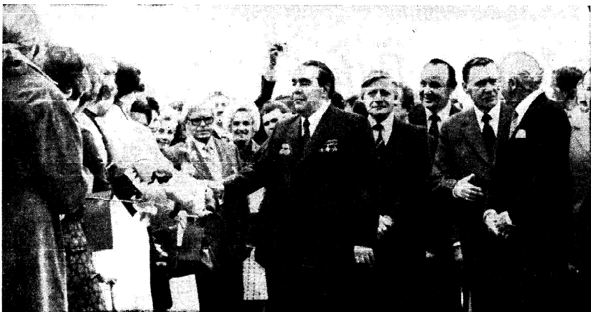
Встреча в аэропорту.